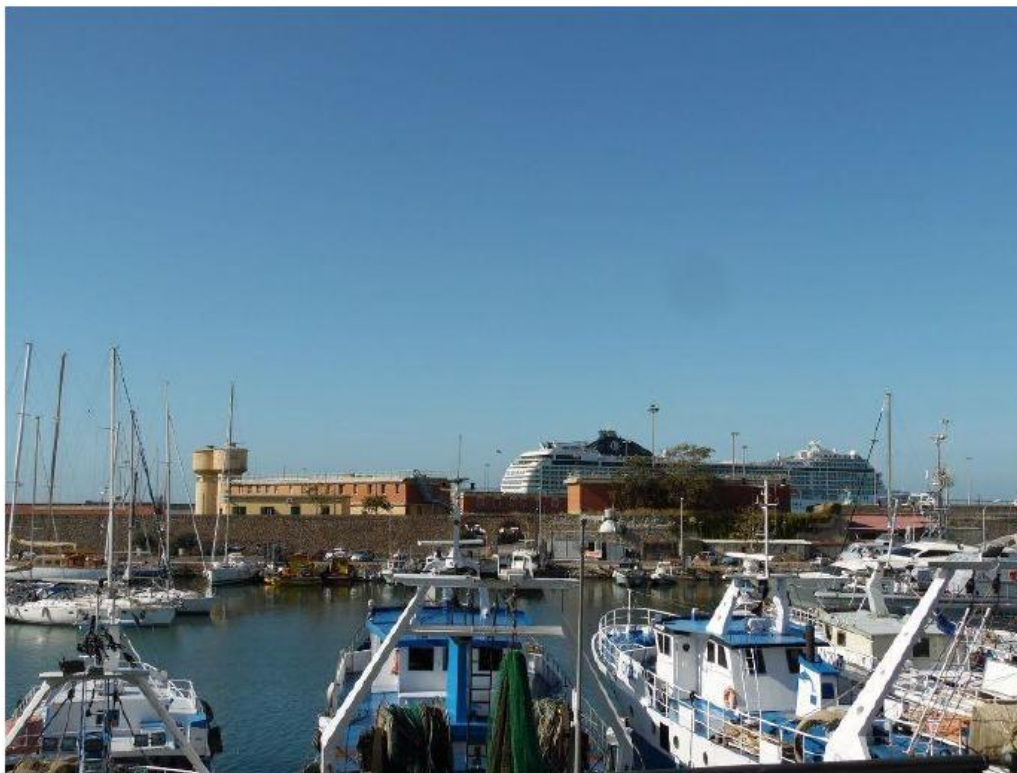
Darsena, 2019.