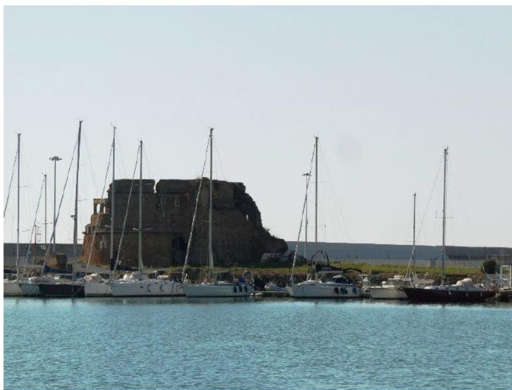
Fortino di San Pietro sul Molo del Lazzaretto, 2019.