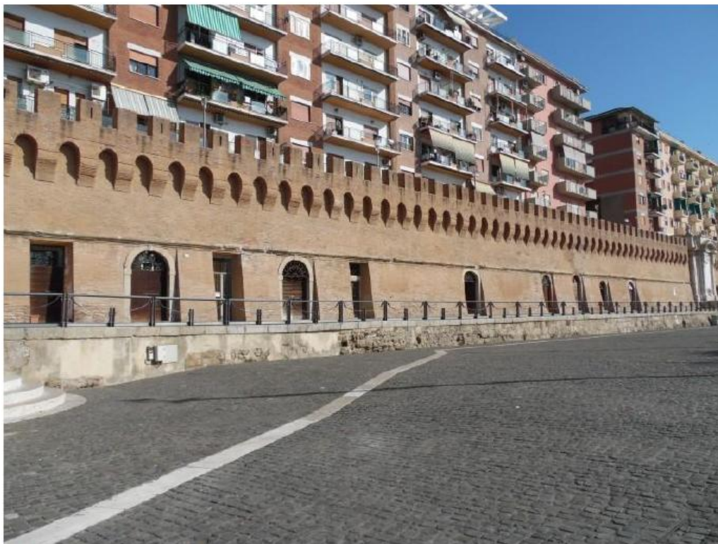
Magazzini romani, 2019. © Manola Solfanelli