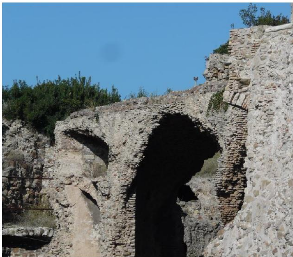
L'antica Rocca sita nel porto storico di Civitavecchia, 2019.